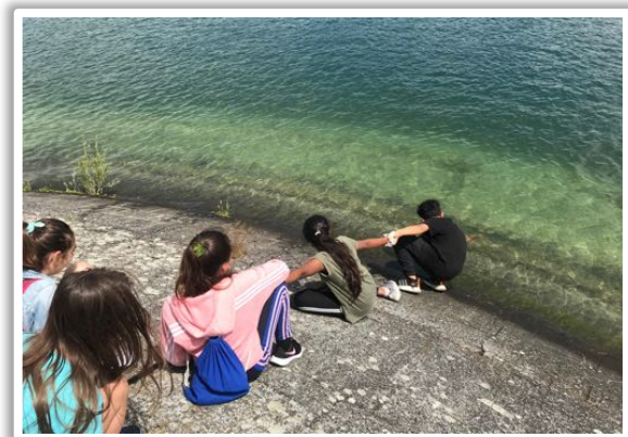
Im Team wurde selbst der letzte Kronkorken aus dem Wasser gefischt.

https://www.sueddeutsche.de/wissen/zigaretten-als-umweltverschmutzung-viel-gift-in-der-kippe-1.1086893 )